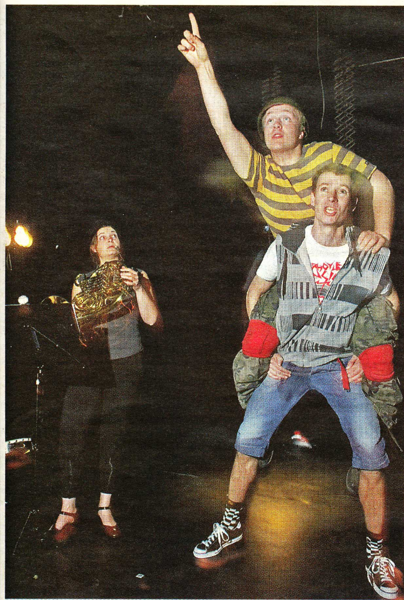
De enthousiaste wervelwinders spelen kleine rolletjes in 'Jimmy'.

boekje doorbladert, kan dat alleen maar beamen. Het Zwolse festival biedt kameropera's van de barok tot nu, van kindervoorstelling tot experimenteel, van dramatisch gebrachte liederencyclus tot aangekleed plot. Schaafsma wist ook dit keer bijzondere namen voor zijn program-