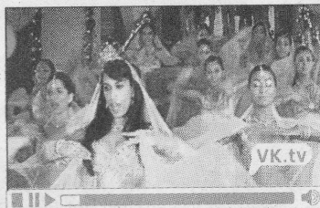
Videoverslag Bollywood-dansles populair op Holland Dance Festival vk.tv/bollywood

tien dansers maakten feeërieke sli- dings op een met water volstro- mende balletvloer. Het opzwie- pende vocht aan hun maaierende ar- men leek de dansers de vleugels te geven, die de hoofdfiguur aan het begin van Alas had afgelegd. Op