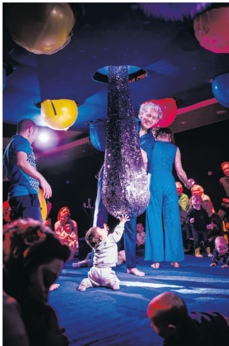
Ouders, kinderen en muzikanten bij de voorstelling Wiegeling .