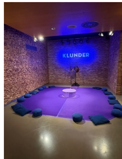
De Kruipsessie in Alkmaar

10 oktober 2025 vindt de eerste Kruipsessie plaats tijdens de opening van het nieuwe seizoen van TAQA Theater de Vest in Alkmaar. In hun gloednieuwe foyer