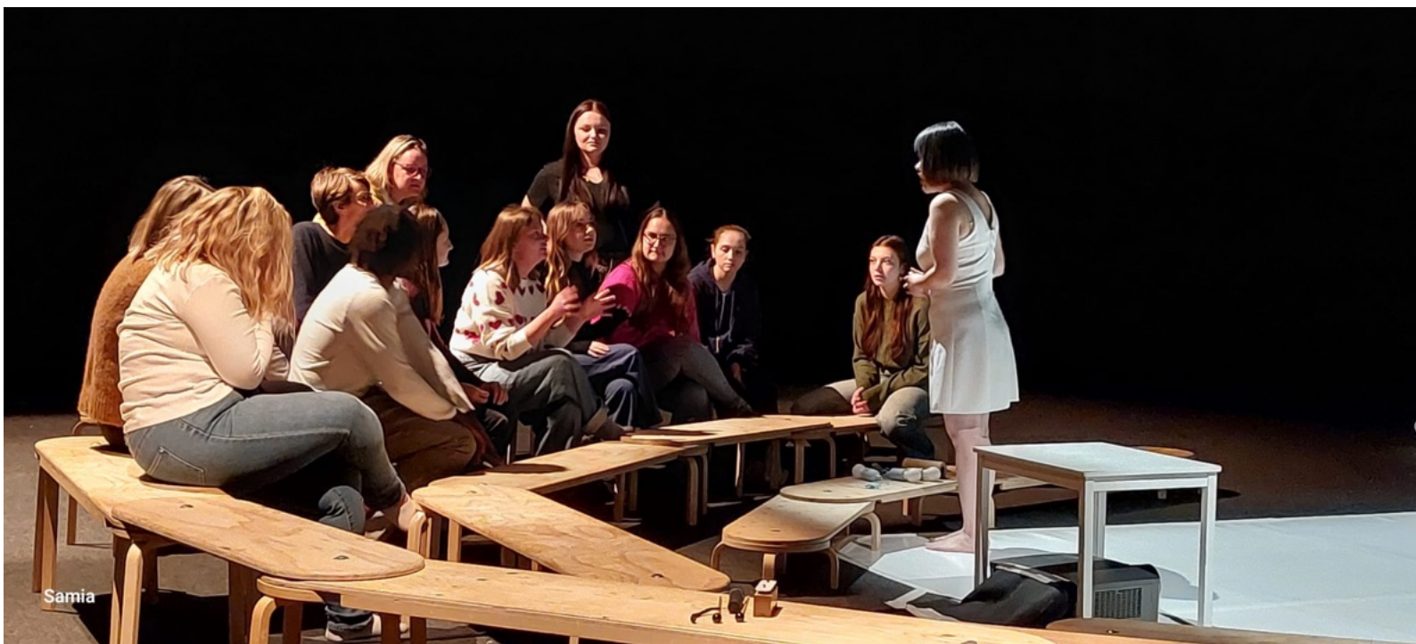
Q&A met studenten kinderopvang bij de voorstelling Luna

11 september - Festival Dziecinada, Wroclaw (PL) (2x)