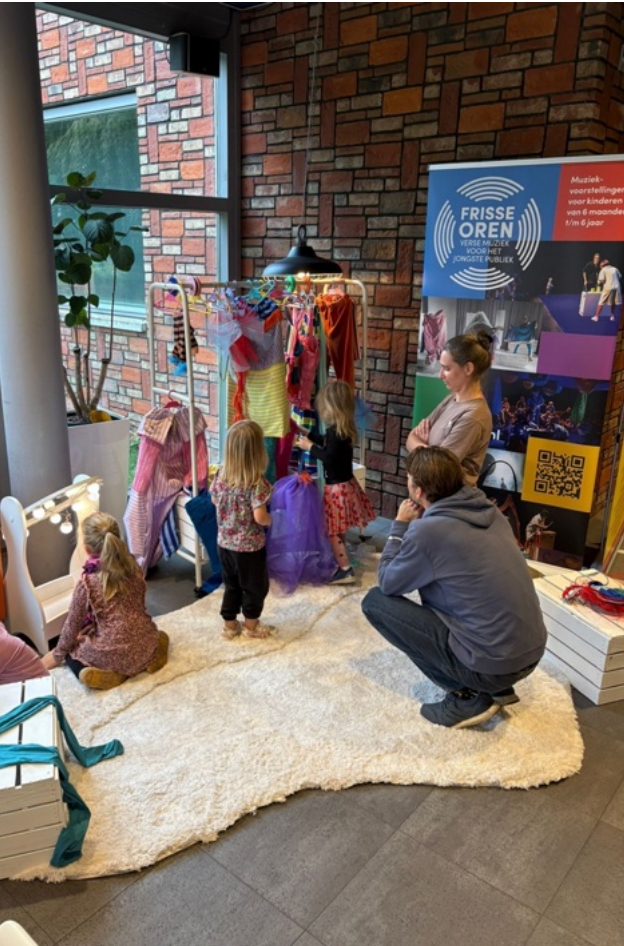
De Kruipruimte van (N)iets aan in Leersum verlengd wordt.

De Kruipsessies blijken voor zowel kinderen als ouders een laagdrempelige en comfortabele kennismaking met muziektheater voor de kleinsten. Ook de lengte van de voorstelling is een pluspunt. De grootte en vorm van De Kruipsessies maken het mogelijk om overal te spelen, maar we (her)ontdekken ook dat een stille omgeving noodzakelijk is. Een leermoment om mee te nemen in het overleg met podia en andere organisaties. In 2026 wordt de nieuwe Kruipsessie gemaakt: 1 plus 1 .