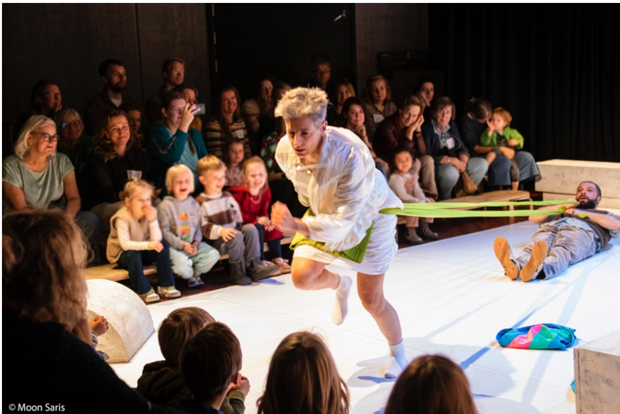
(N)iets aan

De try-outs maken duidelijk dat name het maken van de spanningsboog van de totale voorstelling een uitdaging is. Het samenbrengen van spel en muziek in een consistente theatrale lijn die de kinderen als vanzelf meevoert, blijkt lastig. In samenspraak met componist Bastiaan Woltjer wordt hier een oplossing voor gevonden in de vorm van aanpassingen in het muzikale materiaal. Hierdoor valt alles op zijn plek.