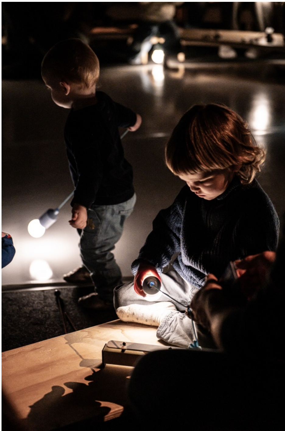
Naspel bij Luna, Festival Musica, Straatsburg